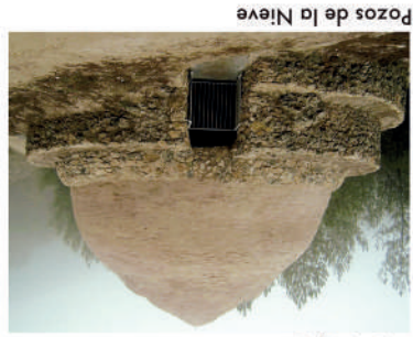
Pozos de la Nieve