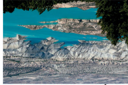
Barrancos de Gebas