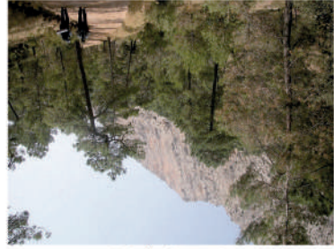
Red de Senderos